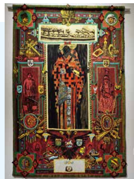
Apotheose der slawischen Nation, 1996 Kelim, nach einem Entwurf von Haralamppiy G. Oroschakoff gewebt, ca. 220 x 150 cm Installation MEM Cannes, Visages des frontiers, 2021/2022