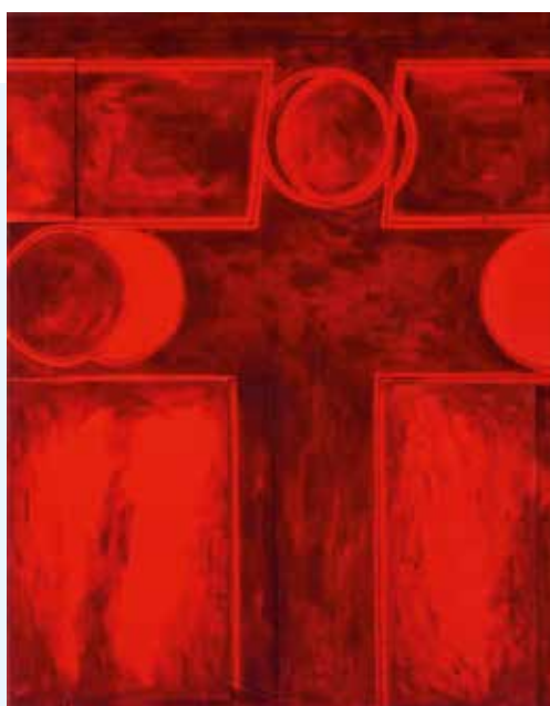
Alright, Mama Dada (1), 2017 Acryl auf Samt, 80 x 63 cm

Ивана III (XV век), к византийскому беженцу Харалампию Гаври, ставшему игуменом Спасо-Елеазаровского монастыря под Псковом. В Великом Новгороде начинается собственно история рода, имя которого связано с названием замка Орешак (Орешек) на ладожском острове Орехово. С боярином Орешко вступают мои предки (в 1552 году) на политическую арену. Другой пример: Иван Хараламов Орешек, участвовавший в качестве переводчика в дипломатической миссии князя Трубецкого при дворе курфюрста Бранденбургского накануне Великой Северной войны. Примечательна также роль моего прапрадеда Гавриила, работавшего вместе с Иваном Аксаковым в Московском славянофильском комитете, а потом по зову князя Черкасского участвовавшего в создании Болгарского княжества, в котором он был прокурором,