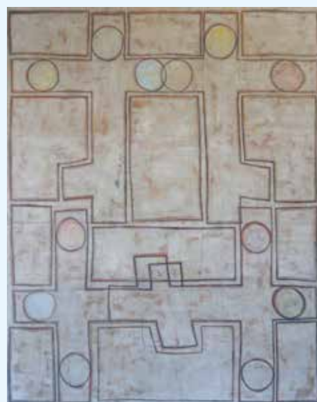
Doppelkreuz Berlin 4, 2015 Pigment, Lackstift auf Leinwand 250 x 200 cm